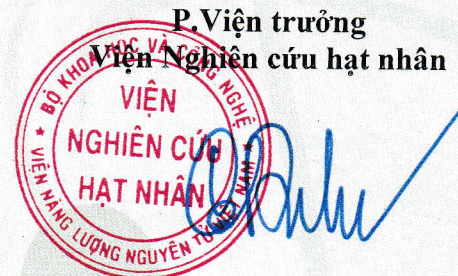
Cao Đông Vũ

Các kết quả thử nghiệm ghi trong phiếu này chỉ có giá trị đối với mẫu do khách hàng gửi đến. KPH – không phát hiện, LOQ: giới hạn định lượng; (*) Các chỉ tiêu được VILAS công nhận ISO 17025:2017 BM 7.8.01- phiếu kết quả thử nghiệm – ban hành lần 1